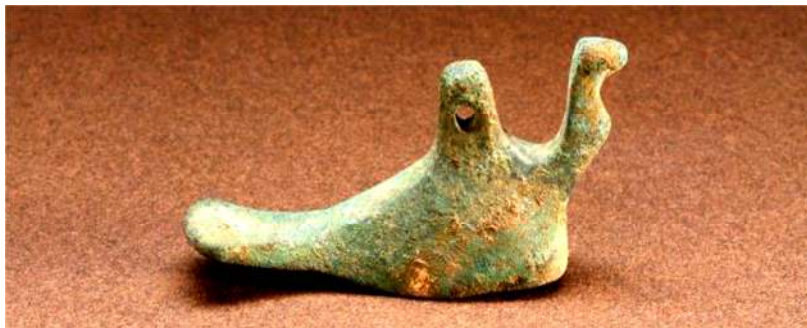
تصویر ۸. پیکرک مجوف مرغ مفرغی یافت شده از جوبن (موزه ملی ایران)

۲۲ تحقیقات تاریخ اجتماعی، سال دهم، شماره اول، بهار و تابستان ۱۳۹۹