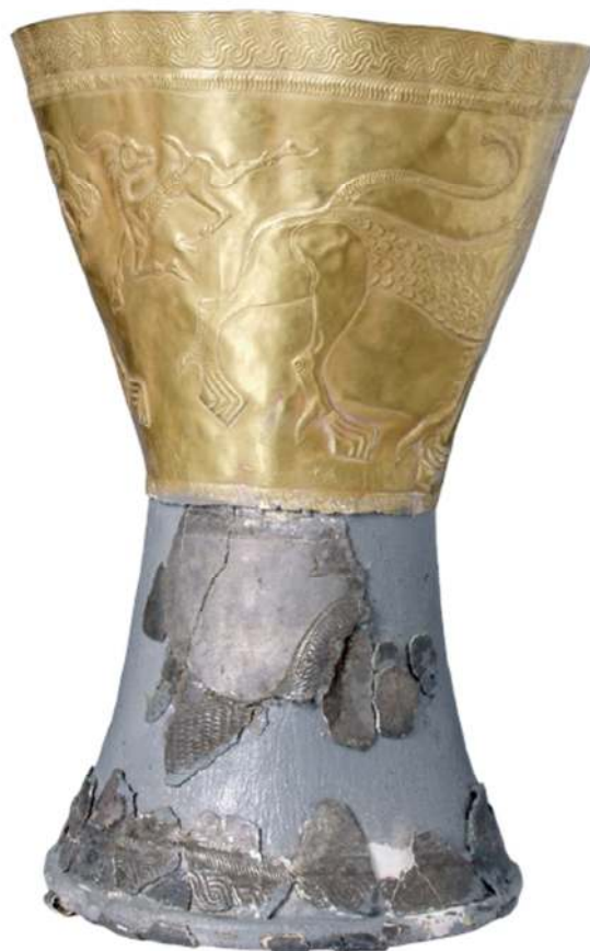
تصویر ۲. جام زرین و سیمین از گور ۷ در داغداغان کلورز (موزه ملی ایران)