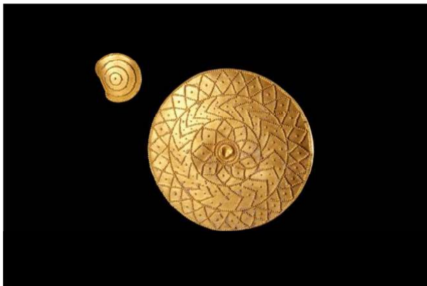
تصویر ۱. صفحه زرین از ترائشه ۱۸ گور ۱ در کلورز با قطر ۷ سانتی متر (موزه ملی ایران)

گور ۲-۳ گور دوم دربردارنده یک دهنه مفرغی اسب به طول ۱۹/۸ سانتی متر، ۸ عدد تزئینات زین اسب، ۳ عدد میخ مفرغی مربوط به تزئینات زین اسب، شماری دکمه مفرغی، پلاک مفرغی مدور با حلقه درشت و برجستگی کوچکی در وسط آن و شماری قطعه شکسته مفرغی بود (حاکمی، ۱۳۴۷).