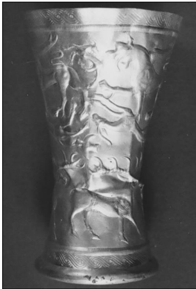
تصویر ۳. جام زرین کلورز

برخی از پیکرک‌های یافت‌شده در کلورز و جوبن همچون گوزن را می‌توان با پیکرک‌های مجموعه شاهزاده نوروز در روستای باسکان (Baskan) بالا در نزدیکی کوه البروس در قفقاز روسیه سنجید که جزیی از فرهنگ کوبان قلمداد شده‌اند (برای آگاهی بیشتر بنگرید به Curtis and Kruszynski, 2002: Fig. 18: 107). همچنین پیکرک اسب و سوارکاری که در وسط زین نشسته و شمشیری بر کمر دارد و با دو دست قبضه و غلاف آن را گرفته است، شباهت‌هایی با یافته‌های حوضه مینوسینسک (Minusinsk) در آلتایی دارد (Bokovenko, 1995: fig. 21). پیکرک‌های گوزن و نیز خاکسپاری‌های جانوران دیگری همچون سگ مشابه محوطه خرم‌آباد مشکین‌شهر و گراز نشان‌دهنده فرهنگ سکایی است.