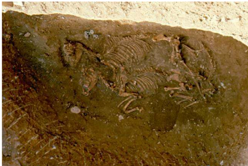
تصویر ۴. خاکسپاری اسبها در کنار یکدیگر در کلورز (بایگانی حاکمی)