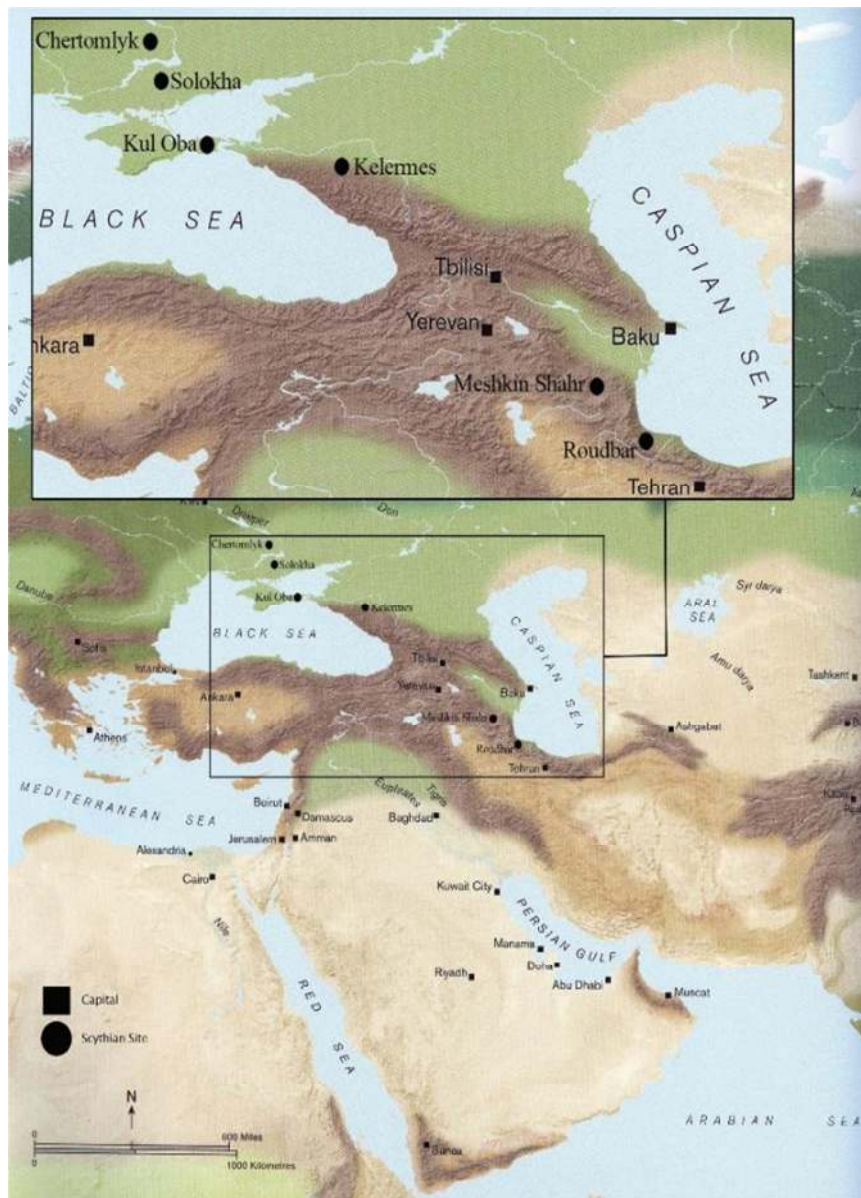
تصویر ۹. پراکنش محوطه‌های سکایی در ایران و قفقاز و جانمایی دو محوطه مهم رودبار و مشگین‌شهر (Alexeyev, 2017: 19، با تغییرات)

بررسی حضور سکاها در رودبار گیلان در هزاره یکم ... (شاهین آریامنش و سیدمهدی موسوی) ۳۳